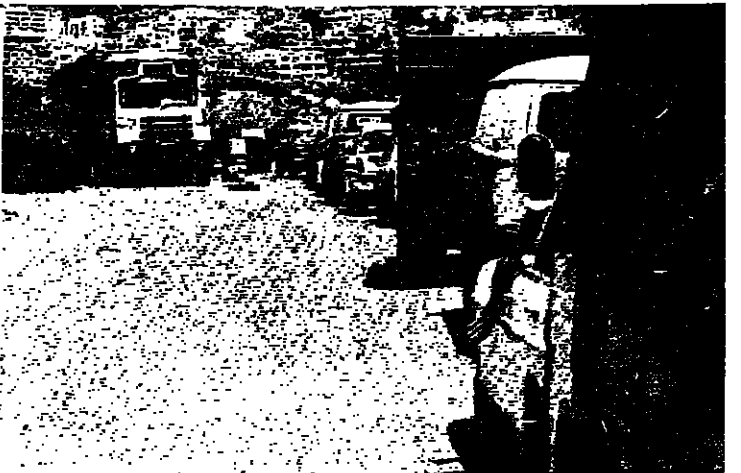
ازدحام على معبر الكفءات أمس